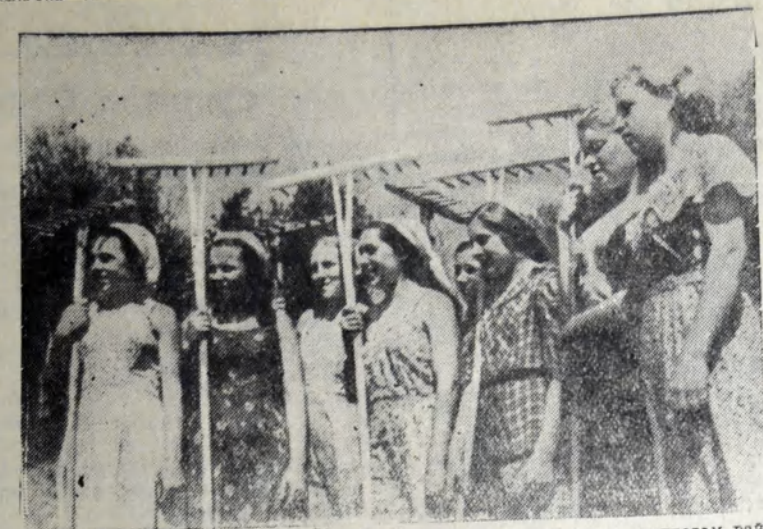
Большую помощь на полевых работах оказывают учащиеся колхоза района. На снимке: учащиеся направляются на уборку сена в колхозе „Ветрочка“.

В течение 25 июля наши войска вели бой с противником на Порховском фронте.