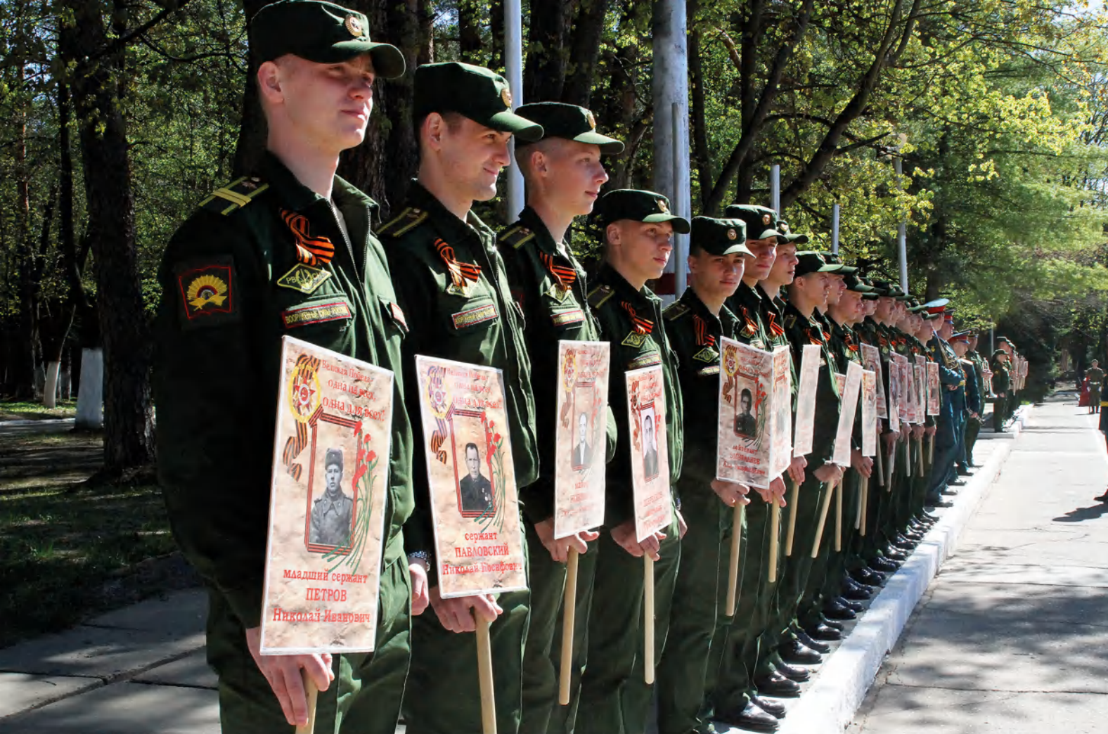
➤ Курсанты Серпуховского филиала Военной академии РВСН имени Петра Великого выстроились на плацу, приняв участие в торжественном мероприятии 6 мая 2017 года.