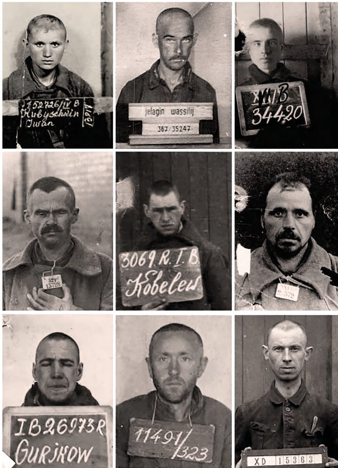
Сотни лиц, сотни судеб. То, что мы публикуем на страницах альманаха «Воинская доблесть», — лишь малая часть. Безусловно, эта трагическая страница истории нашей страны несправедливо предана забвению, и потому необходимо к ней вновь и вновь возвращаться.