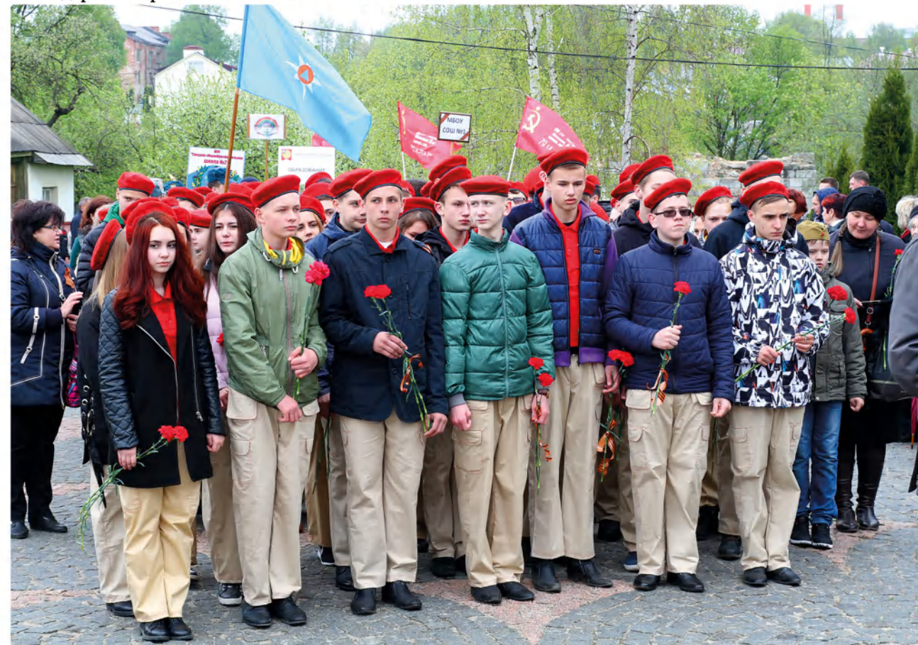
➤ Впервые в торжественных мероприятиях по случаю празднования Дня Победы принимают участие лидеры Юнармии.