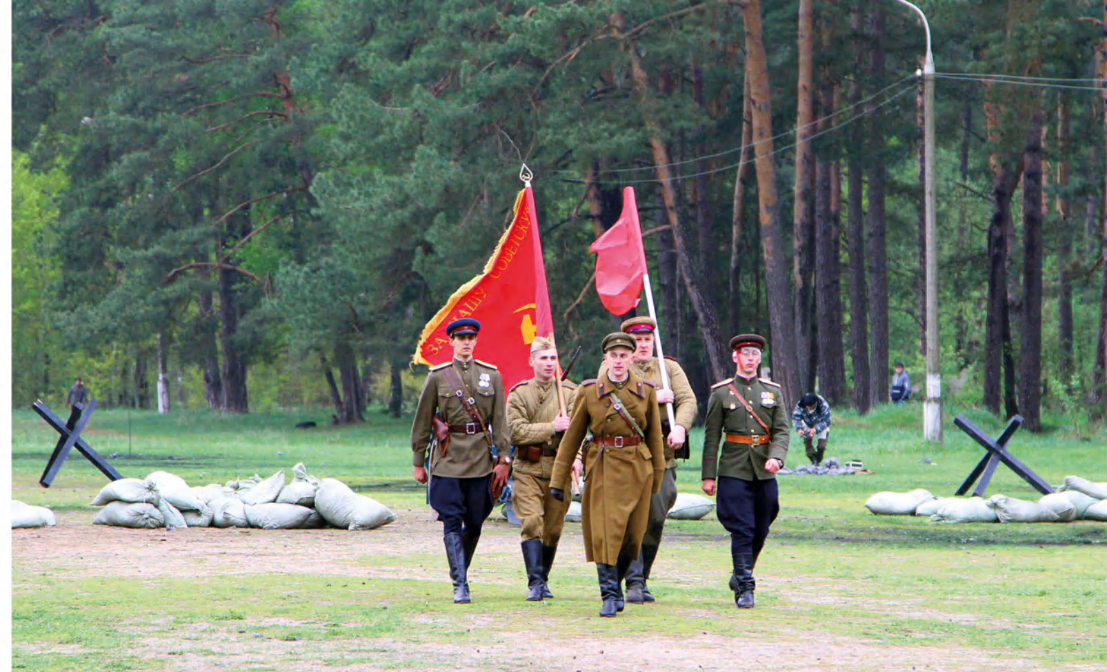
➤ Около трехсот участников воссоздали сражение, произошедшее в мае 1945 года во время наступления Красной армии на Берлин. В сражении также участвовала различная военная техника времен ВОВ: автомобиль, мотоцикл и пушки.