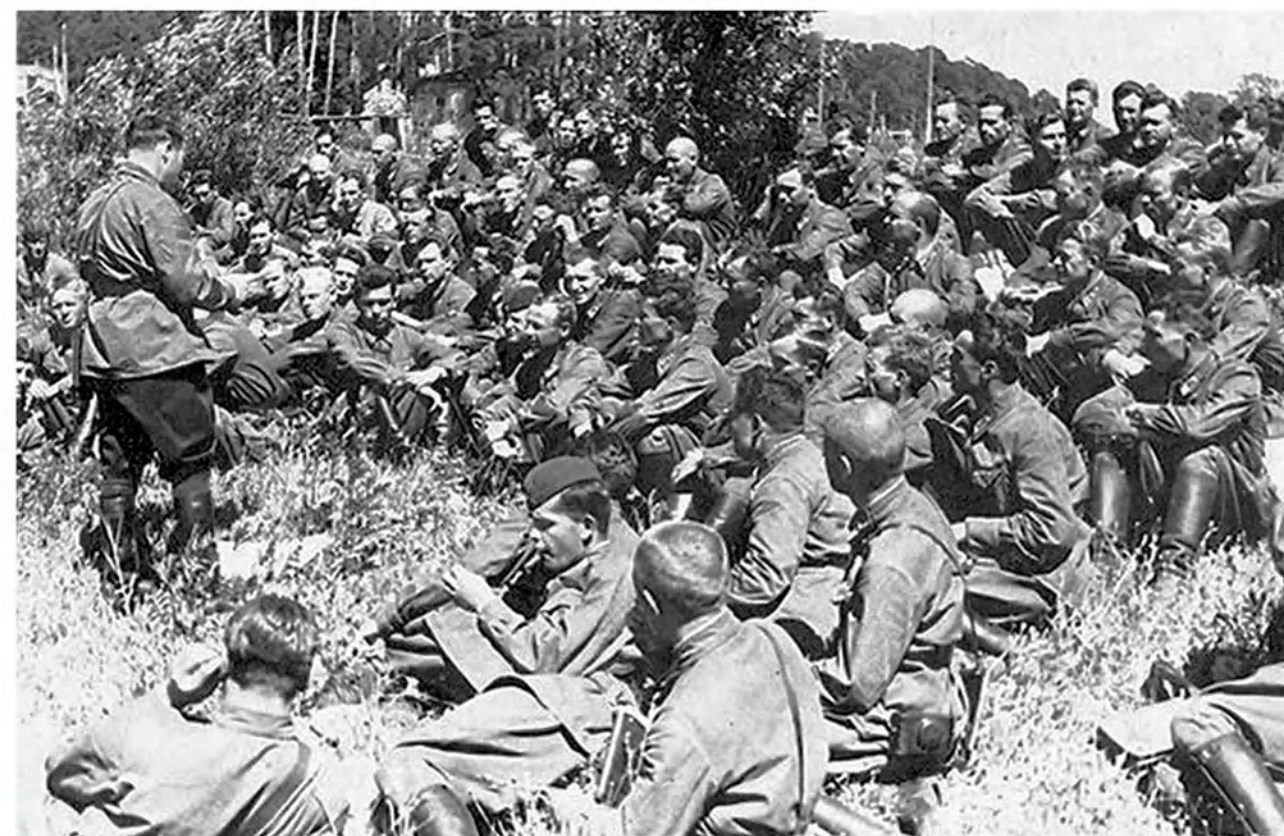
22 июня 1941 года. Германия начала войну против Советского Союза. Митинг в авиационном училище Серпухова.

Военный комиссариат, принимая добровольцев, будет работать круглыми сутками: в первые дни войны изъявят желание уйти на фронт тысячи серпуховичей. В это время в городе будут предприниматься все меры по противовоздушной обороне: то тут, на крыше жилого дома, то