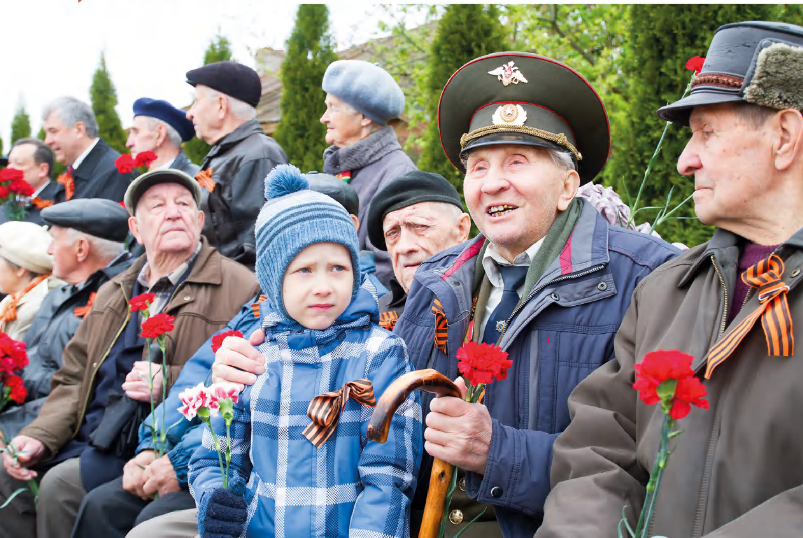
➤ Самое главное, чтобы ветераны были с нами как можно дольше.