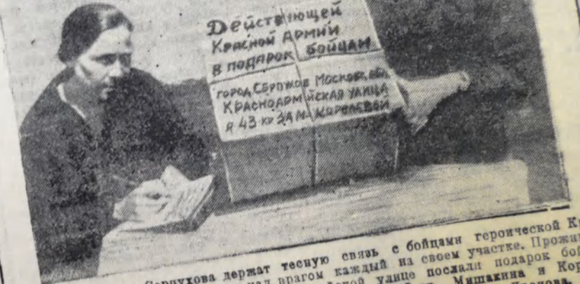
Трудищица Серпухова держит тесную связь с бойцами героической Красной Армии. Упорно куют победу над врагом каждый на своем участке.

Сегодня в Серпухове начинает демонстрироваться, выпущенный киностудией «Союзфильм» военно-художественный фильм «В тылу врага».